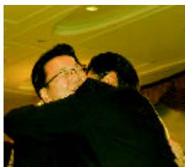
大門元会長から熱い抱擁