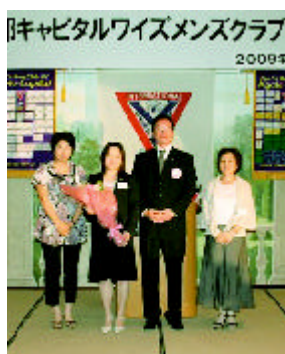
香山メネット会長へ花束