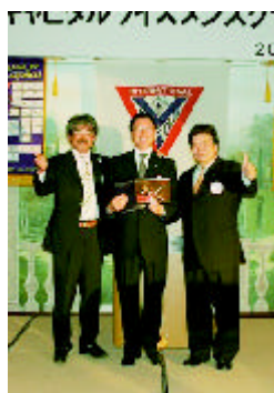
香山会長へ感謝楯