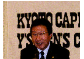
加藤地域奉仕事業主査