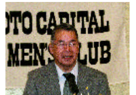
林Yサ・ユース事業主査