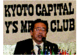
柳ファンド事業主査

聖句の解説 恨みや敵意を心に抱いたままでいると、体や心にさまざまな悪影響を及ぼします。神様は、否定的な感情を「みな捨て去りなさい」と言っておられます。